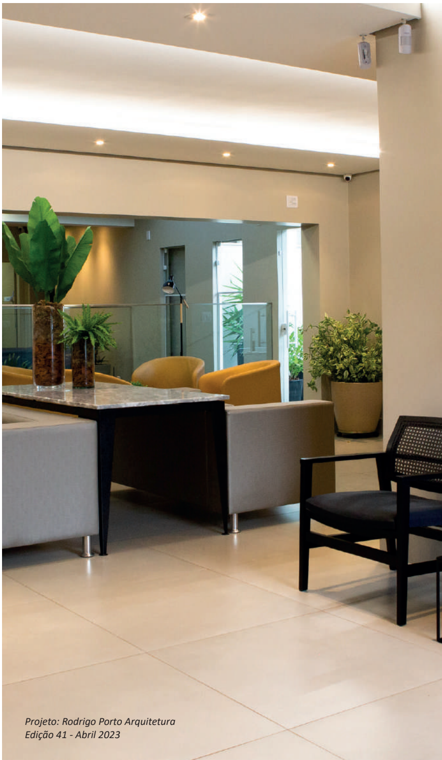
Projeto: Rodrigo Porto Arquitetura Edição 41 - Abril 2023