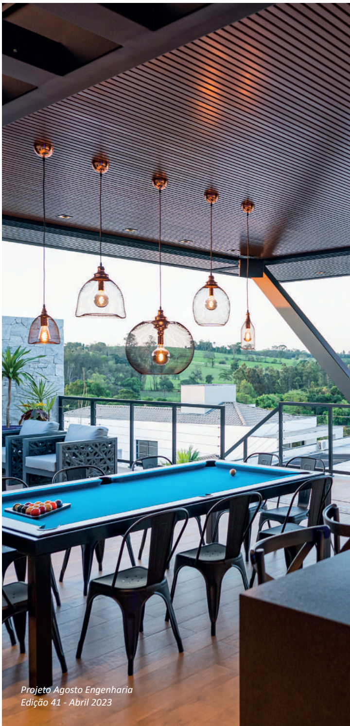
Projeto Agosto Engenharia Edição 41 - Abril 2023